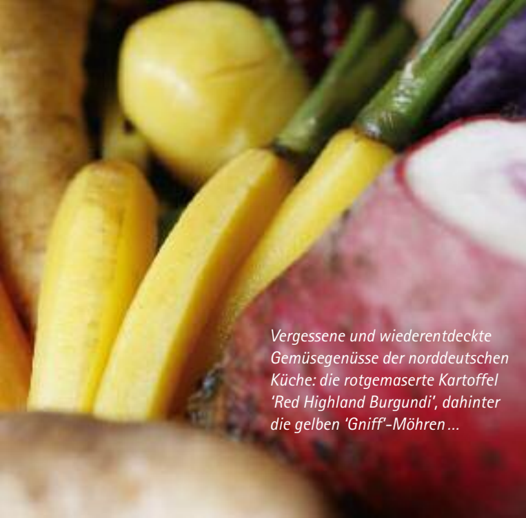
Vergessene und wiederentdeckte Gemüsegenüsse der norddeutschen Küche: die rotgemaserte Kartoffel 'Red Highland Burgundi', dahinter die gelben 'Gniff'-Möhren...