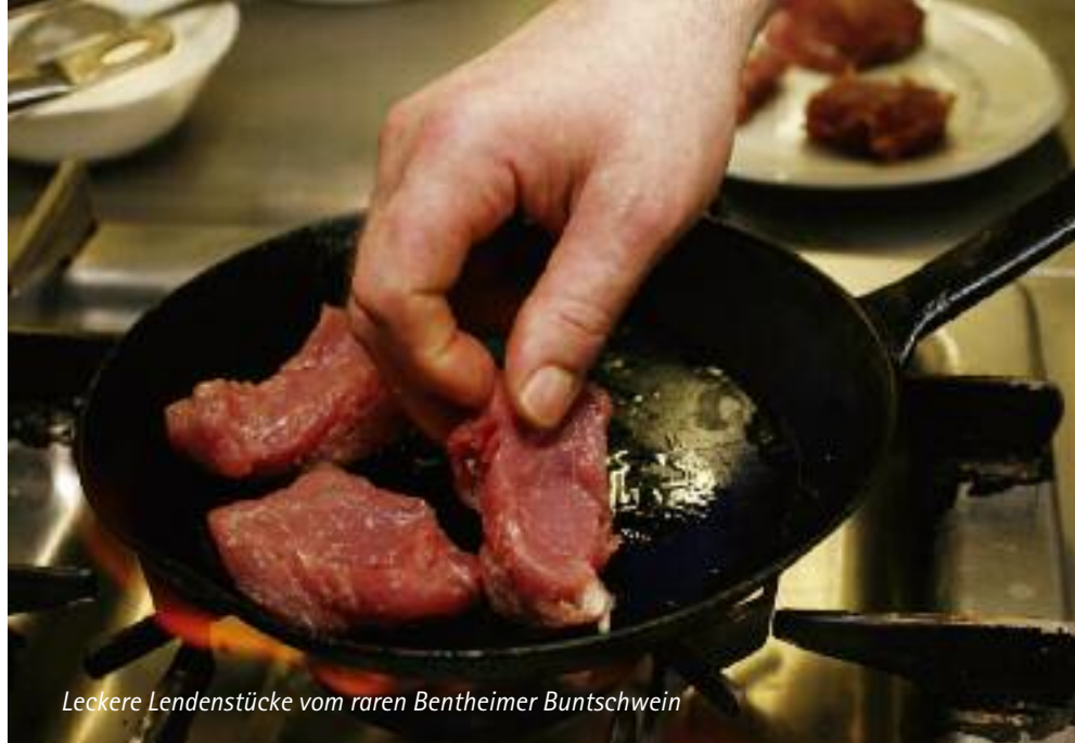
Leckere Lendenstücke vom raren Bentheimer Buntschwein

Weltweit gibt es nur noch 1.000 Parkrinder, davon 30 in Deutschland, wahrscheinlich Nachkommen britischer Auerochsen. →